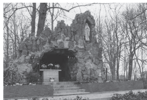
De Lourdesgrot uit 1913 op het kerkhof naast de kerk van St. Jan Geboorte te Zevenhoven.

In de kerk wordt een presentatie getoond over Bernadette Soubirous en worden foto's getoond van Lourdesgrotten in heel Nederland. Op 17 augustus om 19.00 uur vindt de jaarlijkse eucharistieviering, t.g.v. Maria ten Hemelopneming, plaats. Deze viering wordt jaarlijks door vele honderden belangstellenden bezocht. Voor meer informatie kunt u zich wenden tot de heer G. van den Ham tel. 06-12043366.