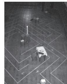
Pastoraal werker Lâm

De avond werd in gepaste stijl afgesloten met de pelgrimszegen en een aandenken van de heilige Christoffel. Zo vervolgden allen met een goed gevoel hun pelgrimstocht in het leven.