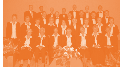
De lustrumcommissie van de Broncantorij