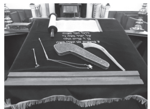
attributen van de synagoge, o.a. Thorarol, jad, ramshoorn.

De heer Levie vertelde ook dat hun doden begraven worden op de Joodse begraafplaats in Katwijk. Op deze begraafplaats liggen ook de stoffelijke resten