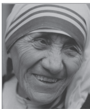
Heilige Moeder Teresa m.c. 1910 - 1997