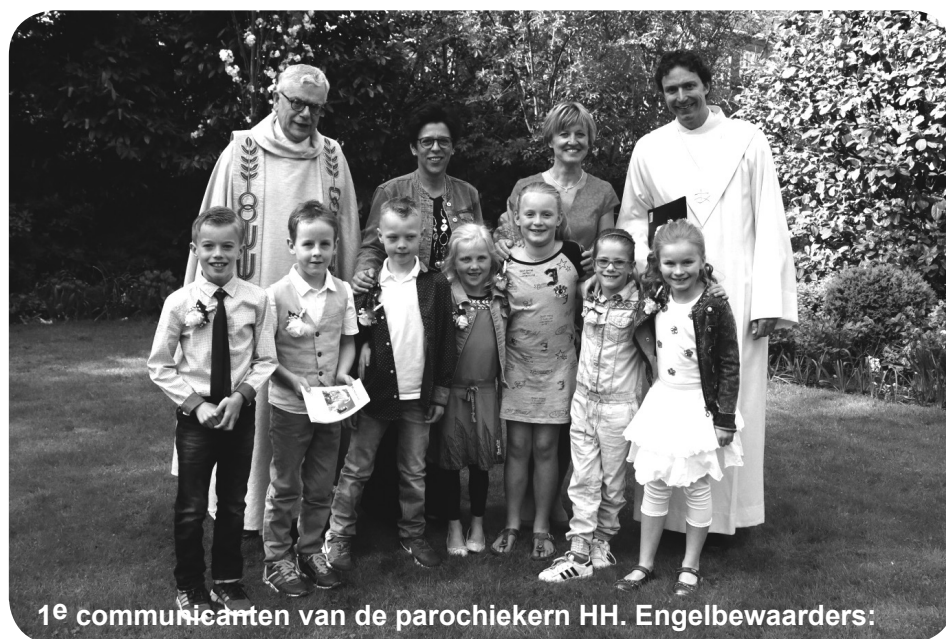
1 e communicanten van de parochiekern HH. Engelbewaarders: