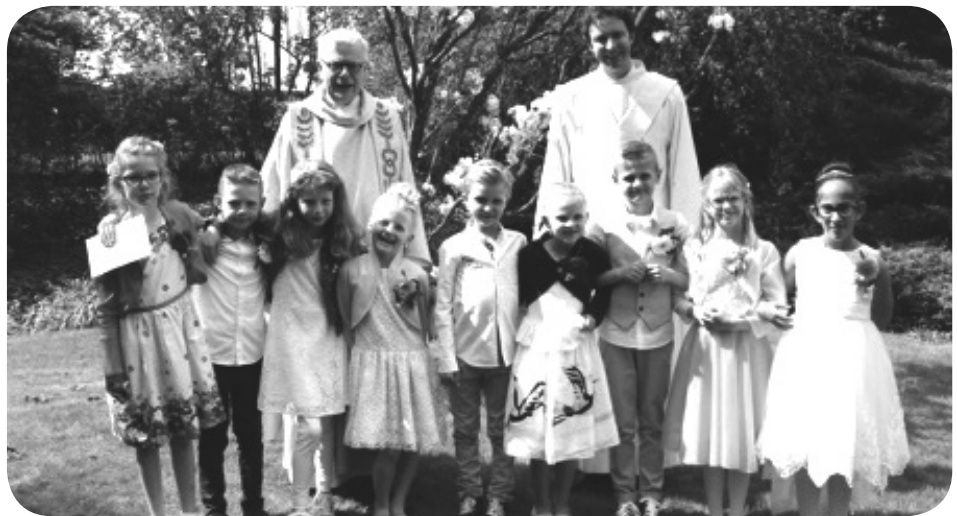
1e communicanten van de parochiekern Michael Bernardus: