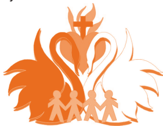
Logo St. Luigi Scrosoppi Centre

Oudtshoorn Alphen aan den Rijn is een wijk in onze gemeente. Vanwege de naamsgelijkenis is er ooit een stedenband ontstaan met Oudtshoorn Zuid-Afrika met het doel van elkaar te leren en elkaar te ondersteunen.