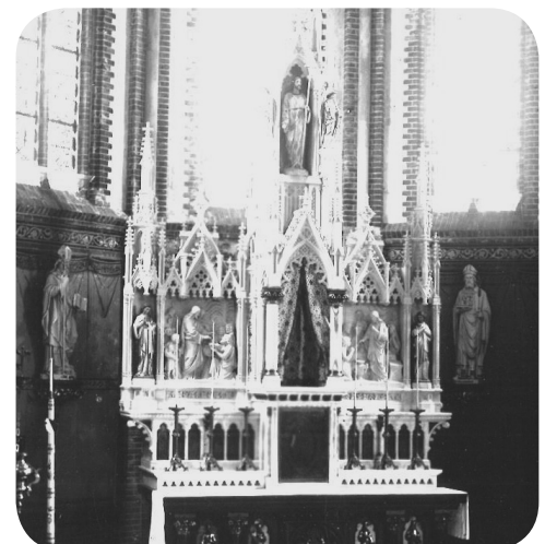
Altaar met beelden

Piet Hoeksel, p/a Paradijslaan 6; sintbonifacius@heilighethomas.nl