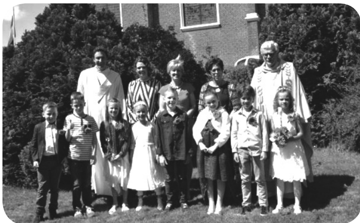
De communicanten van de kern Michael/Bernardus.