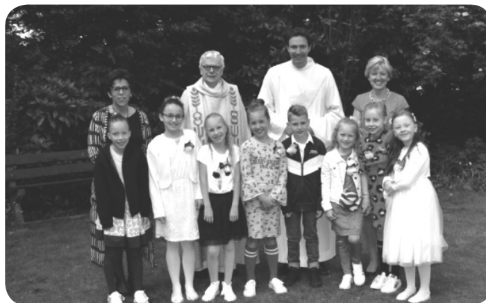
De communicanten van de kern Engelbewaarders.