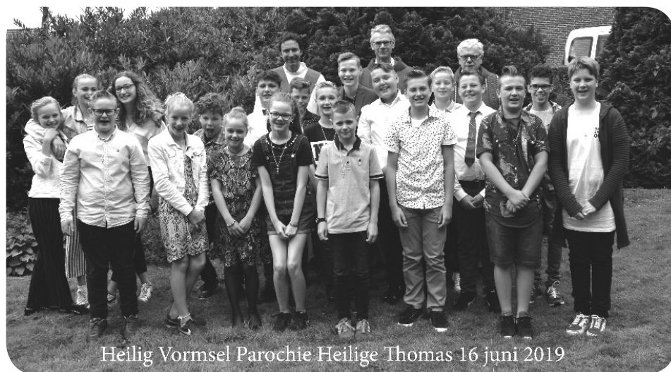
Heilig Vormsel Parochie Heilige Thomas 16 juni 2019