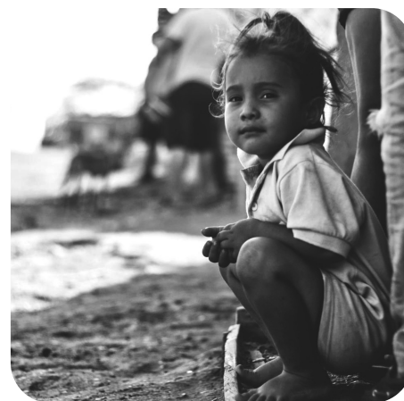
H. Thomas o.v.v. 'Adventsactie Peru'. Hartelijk dank.

In het parochieblad nr. 6 kon u al uitgebreid lezen wat het project inhoudt. Ook kunt u kijken op de website www.vastenactie.nl/adventsactie waar u kunt lezen hoe geschoolde vrijwilligers zich gaan inzetten om hulp te bieden aan de vluchtelingen, veelal moeders en kinderen, uit Venezuela. In Peru hoopt men de zieke en getraumatiseerde kinderen de juiste begeleiding te kunnen geven om een gelukkige toekomst te kunnen opbouwen. Laat hun hoop blijdschap worden. Uw financiële bijdrage kunt u geven in de collecte bij de diaconale vieringen in het weekend van 14 en 15 december of in de collectebus die bij de poster staat of u kunt het overmaken op bankrekeningnummer NL36 INGB 0006192337 t.n.v. parochie