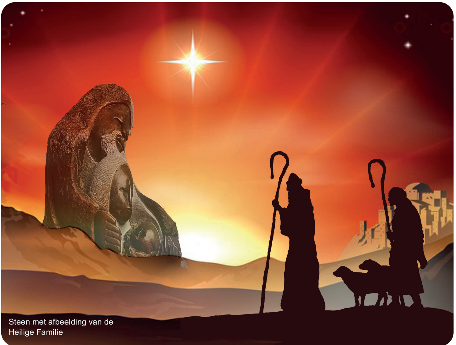
Steen met afbeelding van de Heilige Familie

Rustend bij een kerstkind waar men stilletjes hoopt, waar men stilletjes wenst, rustend bij een kerstkind waar men stilletjes bidt voor vrede in deze wereld.